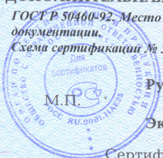
Схема сертификации № 3

ДОПОЛНИТЕЛЬНАЯ ИНФОРМАЦИЯ Маркировка продукции знаком соответствия производится по ГОСТ Р 50460-92. Место нанесения знака соответствия - на изделии и (или) упаковке и в сопроводительной документации.